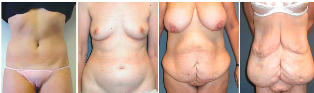
0 = normaal