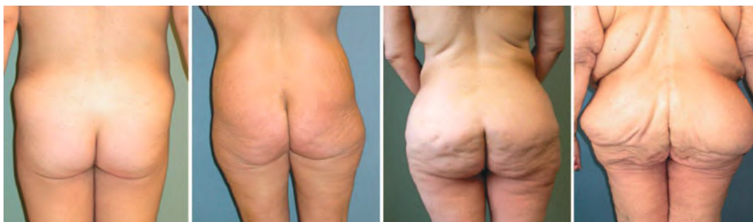
0 = normaal