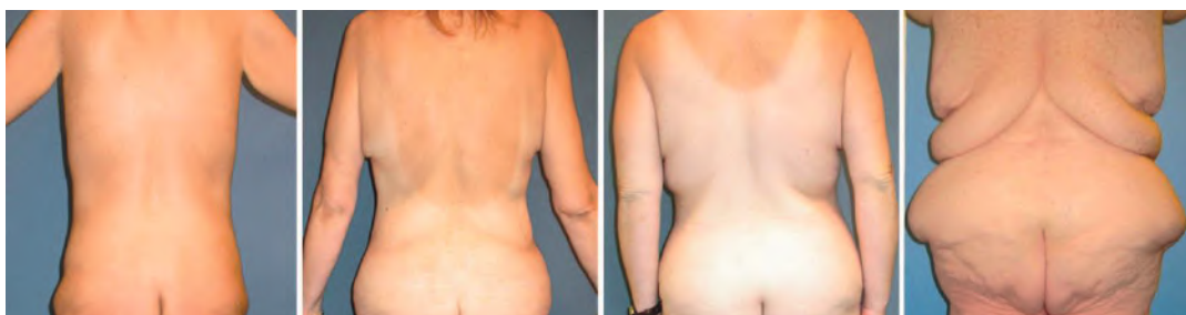
0 = normaal